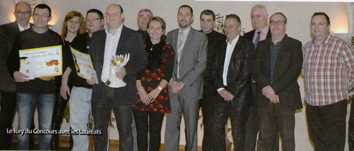
Le Jury du Concours avec les Lauréats